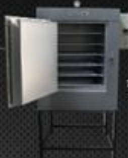
Forno F 300

Capacidade 200 Temp. Regulável 50° a 400° Temp. Trabalho Até 400° Potência 5.000w Volagem 220 volts Prateleira 5