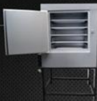
Estufa E 200

Capacidade 100 Temp. Regulável 50° a 300° Temp. Trabalho Até 200° Potência 2.000w Volagem 220 volts Prateleira 4