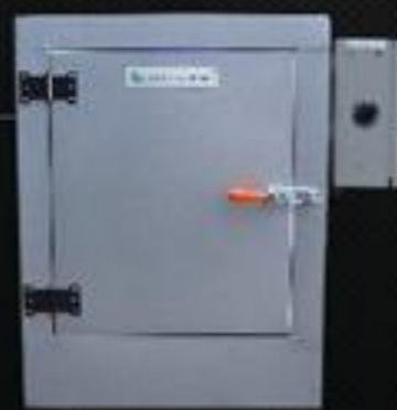
Estufa E 500

Capacidade 300 Temp. Regulável 50° a 300° Temp. Trabalho Até 200° Potência 7.500w Volagem 220 volts Prateleira 6