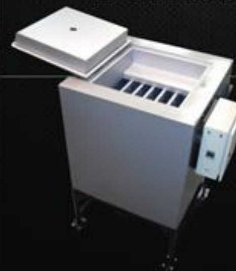
Fornos de Fluxo - Tipo Cilo

Capacidade 250kg Temp. Regulável 50° a 400° Temp. Trabalho Até 400° Volagem 220 volts Dimensões Internas 540x500x600mm