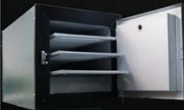
Estufa E 50

Capacidade 10 kg Peso 5 kg Temperatura 125° + - 25 Volagem 220 volts