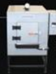
Forno F 75

Capacidade 75 Temp. Regulável 50° a 400° Temp. Trabalho Até 400° Potência 2.500w Volagem 220 volts Prateleira 4