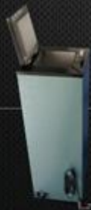
Estufa E 10

Capacidade 5 kg Peso 2,5 kg Temperatura 125° + - 25 Volagem 220 volts