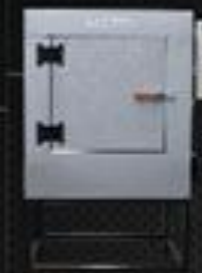
Forno F 200

Capacidade 100 Temp. Regulável 50° a 400° Temp. Trabalho Até 400° Potência 5.000w Volagem 220 volts Prateleira 4