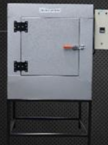
Forno F 500

Capacidade 300 Temp. Regulável 50° a 400° Temp. Trabalho Até 400° Potência 7.500w Volagem 220 volts Prateleira 6