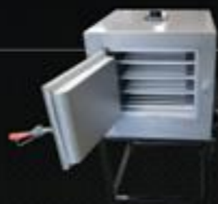
Estufa E 100

Capacidade 100 Temp. Regulável 50° a 300° Temp. Trabalho Até 200° Potência 2.000w Volagem 220 volts Prateleira 4