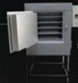
Forno F 100

Capacidade 75 Temp. Regulável 50° a 400° Temp. Trabalho Até 400° Potência 2.500w Volagem 220 volts Prateleira 4