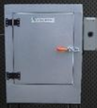
Estufa E 300

Capacidade 200 Temp. Regulável 50° a 300° Temp. Trabalho Até 200° Potência 2.000w Volagem 220 volts Prateleira 5